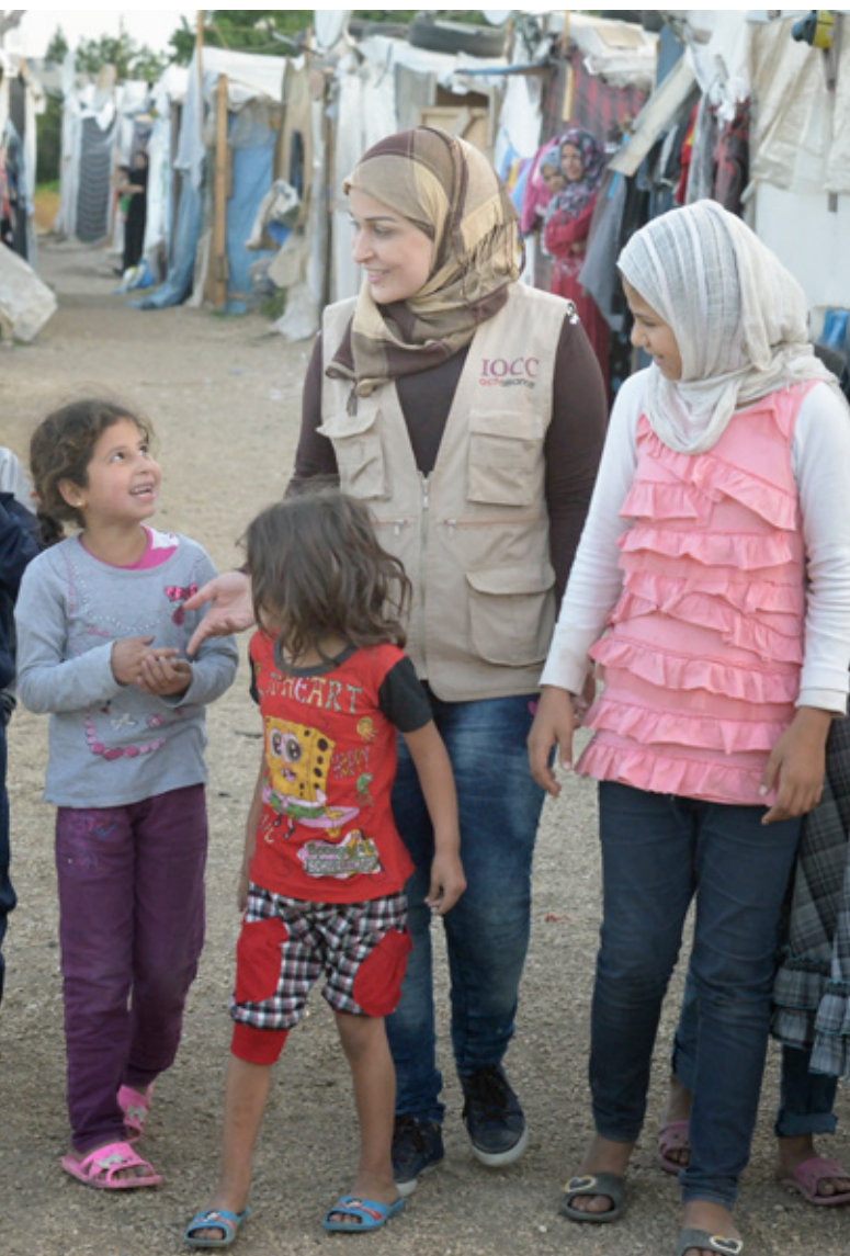
▲ In Libanon ondersteunt Kerk in Actie kerken en christelijke organisaties om bakens van hoop te zijn.

Kerk in Actie is onderdeel van de Protestantse Kerk in Nederland. In samenwerking met lokale kerken en partnerorganisaties in meer dan dertig landen