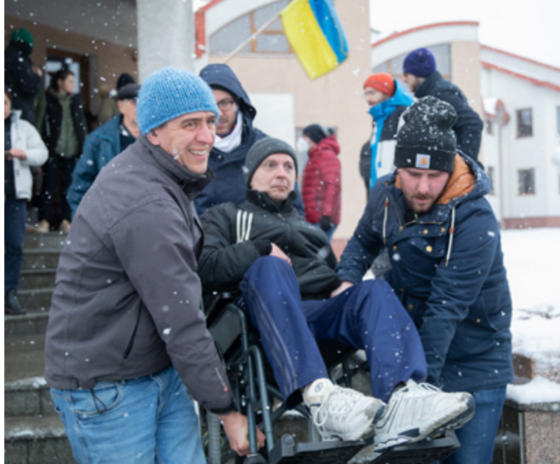
▲ Kerkelijke gemeenten ontplooiën diverse activiteiten voor vluchtelingen uit Oekraïne.

De afgelopen 12 jaar gaf Kerk in Actie al steun aan het UEP. Het traint jongeren in het opzetten van diaconale en maatschappelijke initiatieven vanuit lokale kerken en met kleine ngo's. Na de start van de oorlog zette het UEP samen met deze basisgroepen in heel Oekraïne lokale centra op. Vanuit Lviv werden er noodhulpgoederen aan deze centra geleverd. Via de centra werden Oekraïners ook naar veiliger plekken geëvacueerd. Ontheemden kregen er tijdelijk onderdak, en duizenden mensen konden er eten.