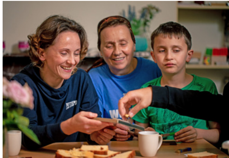
▲ De Thuisgevers.

Waar het oog van de wereld vaak focust op de laatste crisis, proberen we bij Kerk in Actie breder te kijken. We zijn dankbaar dat ons werk ook in 2022 in de volle breedte kon doorgaan. Onze partners boden noodhulp op plekken waar elke dag telt. En tegelijk konden ze bouwen aan structurele verbetering in kwetsbare situaties.