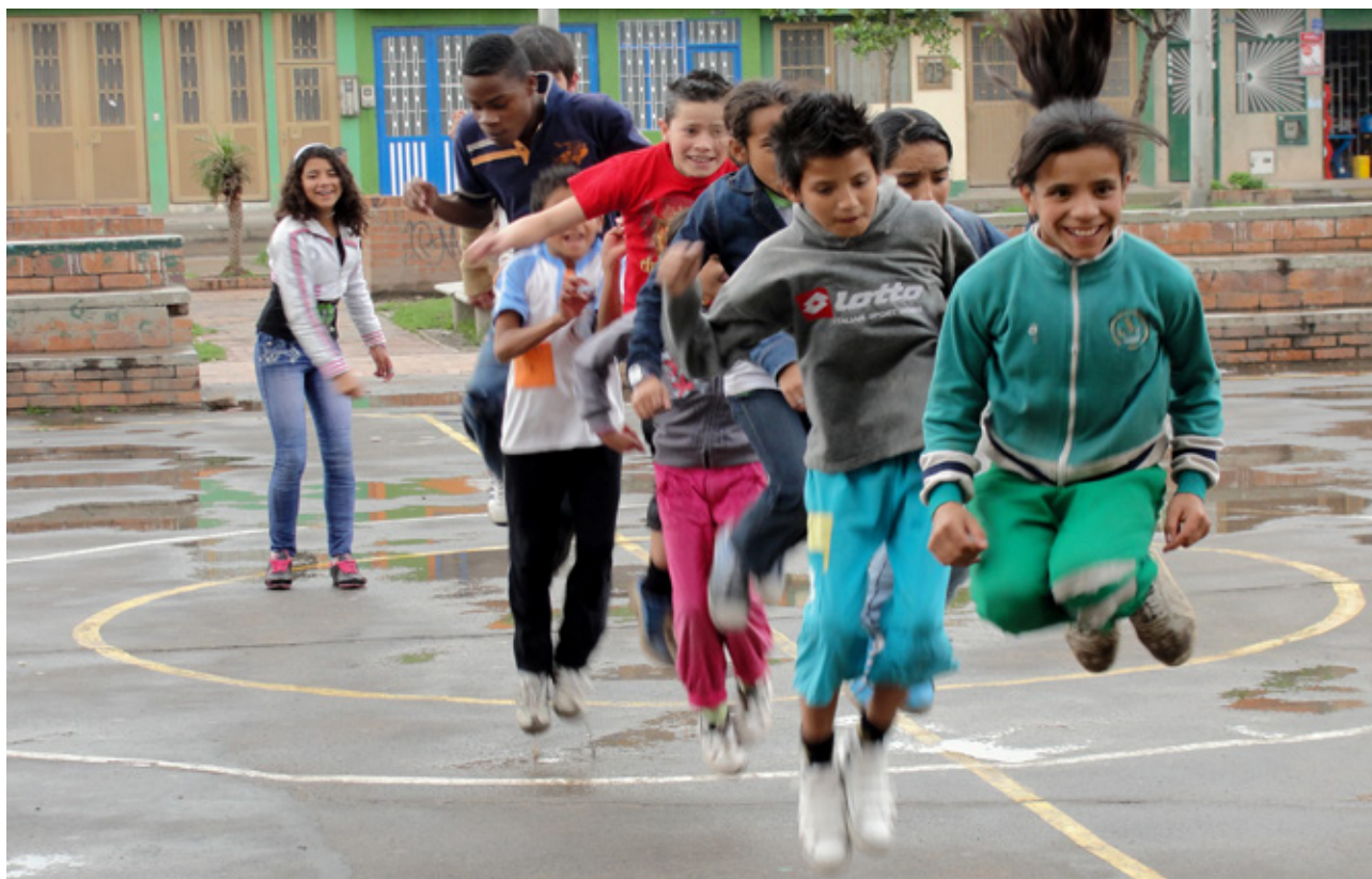
▲ In Colombia ondersteunt Kerk in Actie onder meer een stichting die zich inzet voor kinderen en jongeren in een achterstandswijk vol criminaliteit.

Kerk in Actie werkt met haar partners aan duurzame oplossingen voor problemen. Onze steun is erop gericht dat het welzijn van doelgroepen aantoonbaar en structureel verbetert. De zorg voor de aarde krijgt daarin veel aandacht. We vragen ons telkens af hoe ons handelen de schepping beïnvloedt. Dat komt bijvoorbeeld tot uitdrukking in de keuze van onze projecten, in ons reisbeleid, ons beleggingsbeleid en onze bedrijfsvoering (meer hierover in 1.7).