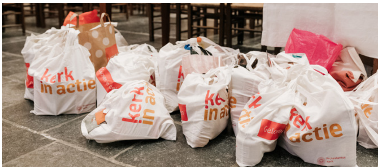
▲ Lokale diaconieën ondersteunen mensen in armoede onder meer via donaties aan voedselbanken, in de vorm van levensmiddelen en/of geld.

In het buitenland zijn we actief op al onze vijf speerpunten. In Nederland richten we onze aandacht vooral op punten waar de overheid of de samenleving gaten laat vallen. We zien een groeiende armoede en we ervaren dat de opvang van vluchtelingen zwaar onder druk staat. Daarom