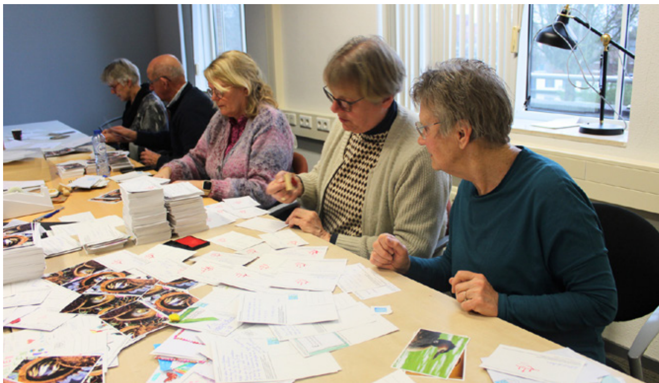
▲ Vrijwilligers aan het werk voor de paasgroetenactie.

Kerk in Actie is heel dankbaar dat zoveel vrijwilligers zich pro deo inzetten, met hart, handen en deskundigheid. Sommige vrijwilligers zijn wekelijks in touw, andere zijn op afroep beschikbaar. Hun inzet doet veel meer dan alleen de werkdruk verlichten, het is een essentieel onderdeel van het werk van Kerk in Actie.