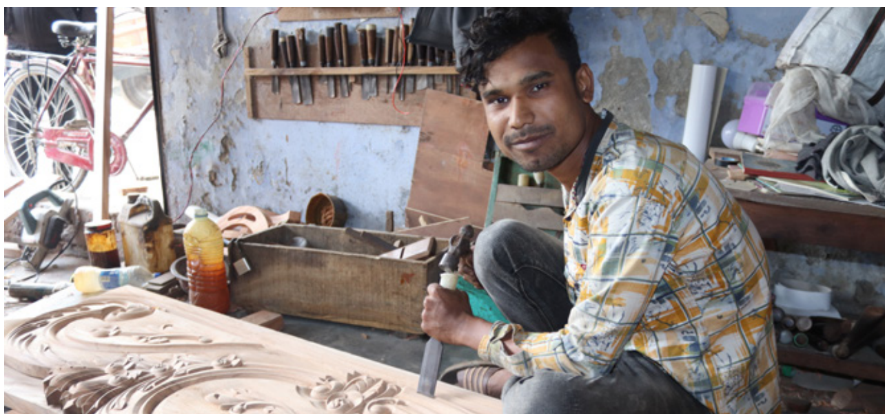
▲ Samen met een partnerorganisatie ondersteunt Kerk in Actie jongeren bij het vinden van werk in Bangladesh.

In 2022 hebben onze relatiebeheerders en finance officers de partners en projecten weer ter plekke kunnen bezoeken. Dankzij de twee jaren van reisbeperkingen door corona is online contact nu ook een vast en waardevol onderdeel van het relatiebeheer geworden.